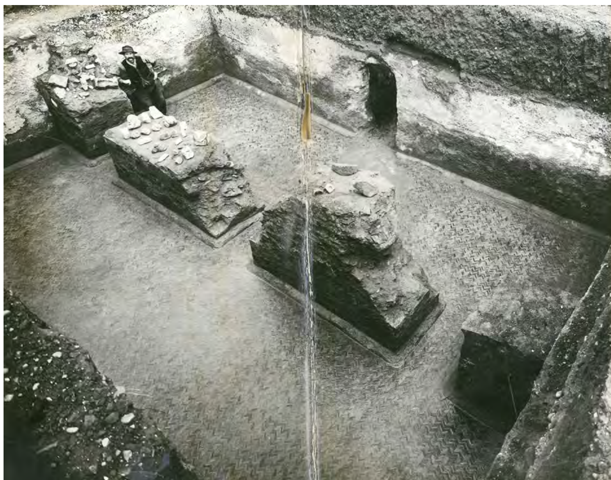
Archives 057, 06, 02, 02. Site non identifié

CARTON 06. Sorbonne, chaire d'archéologie : collections et clichés pour édition.